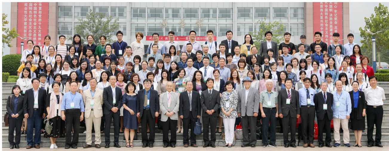
第1回東アジア日本学研究国際シンポジウム（魯東大学）