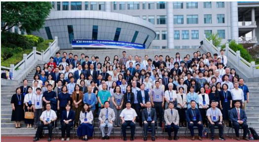
跨文化背景下中日人文交流及区域別研究会暨第七届东亚日本学研究会学术研讨会 2025年8月15日—2025年8月17日 中国・延辺大学